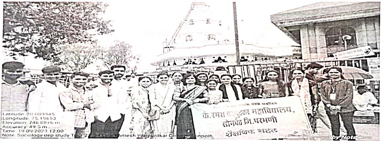
Visit to Grihshreshwar Mandir Ellora