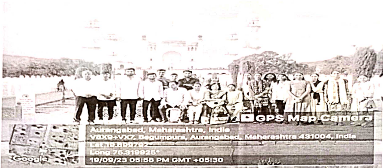
One tour to Aurangabad visit at BIBI ka Maqbara 2023/24